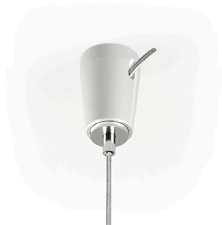
Dispositivo di sospensione e regolazione per fune in acciaio.