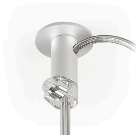
Dispositivo di sospensione e regolazione per cavo elettrico.