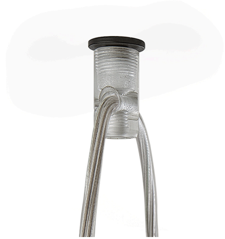
Suspension en polycarbonate.